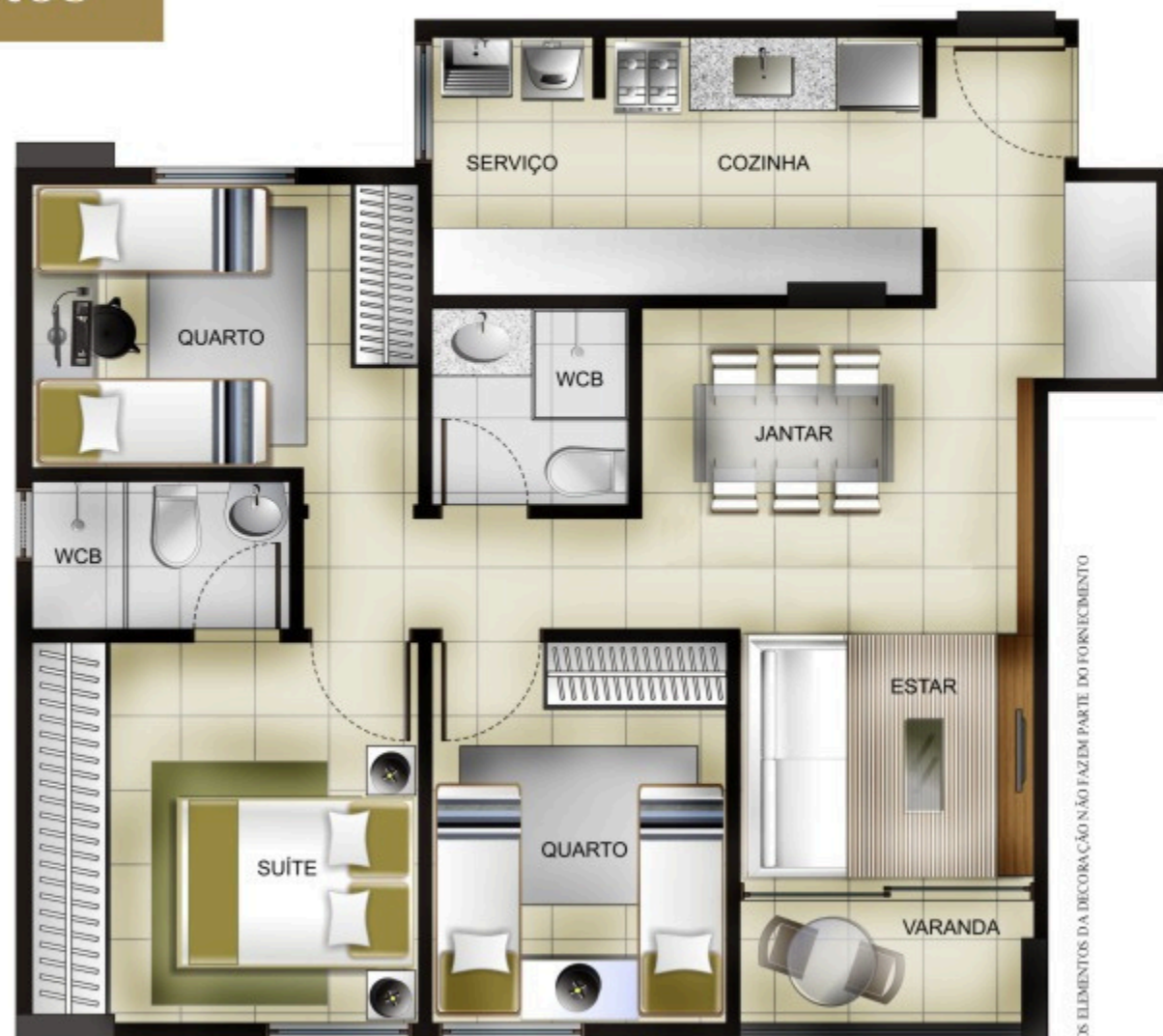
PLANTA BAIXA AMBIENTADA

OS ELEMENTOS DA DECORAÇÃO NÃO FAZEM PARTE DO FORNECIMENTO