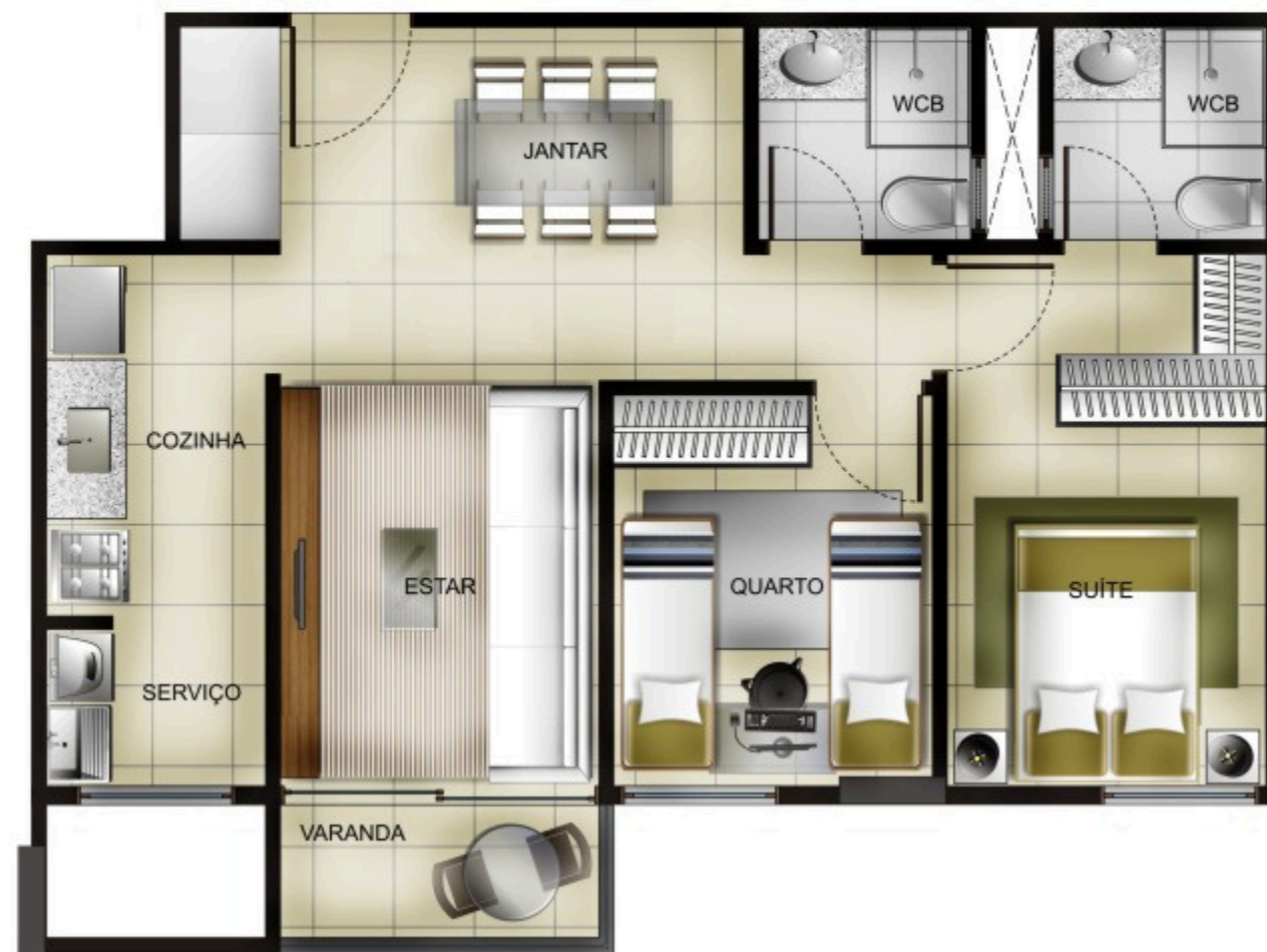
PLANTA BAIXA AMBIENTADA

OS ELEMENTOS DA DECORAÇÃO NÃO FAZEM PARTE DO FORNECIMENTO