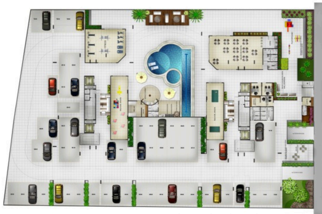
PLANTA BAIXA DO PAVIMENTO PILOTIS

Se você prioriza uma qualidade de vida que esteja alinhada ao seu lazer, bem-estar, liberdade e segurança, aqui é o lugar ideal para você.