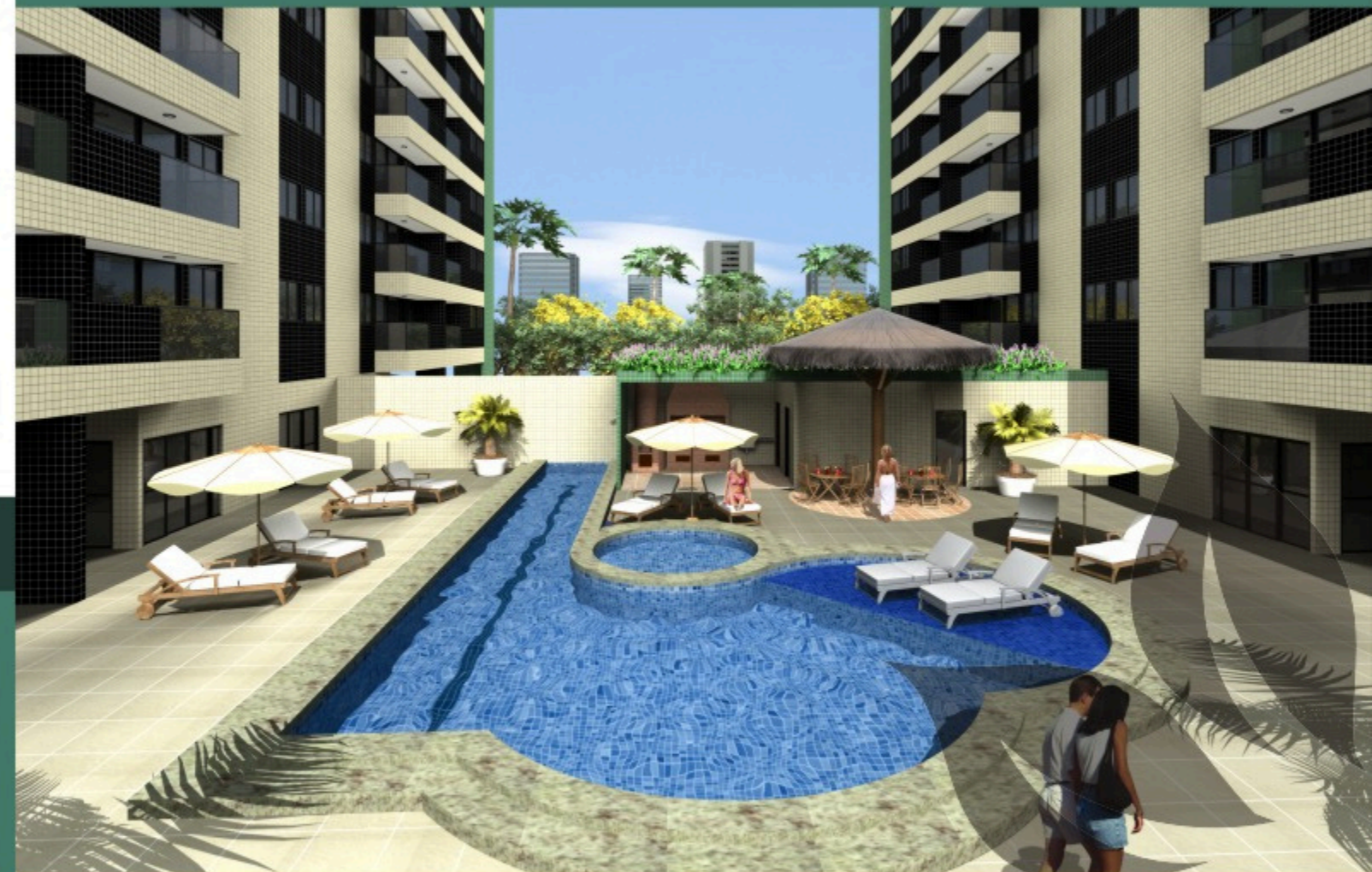
VISTA DA ÁREA DE LAZER E ESPAÇO GOURMET