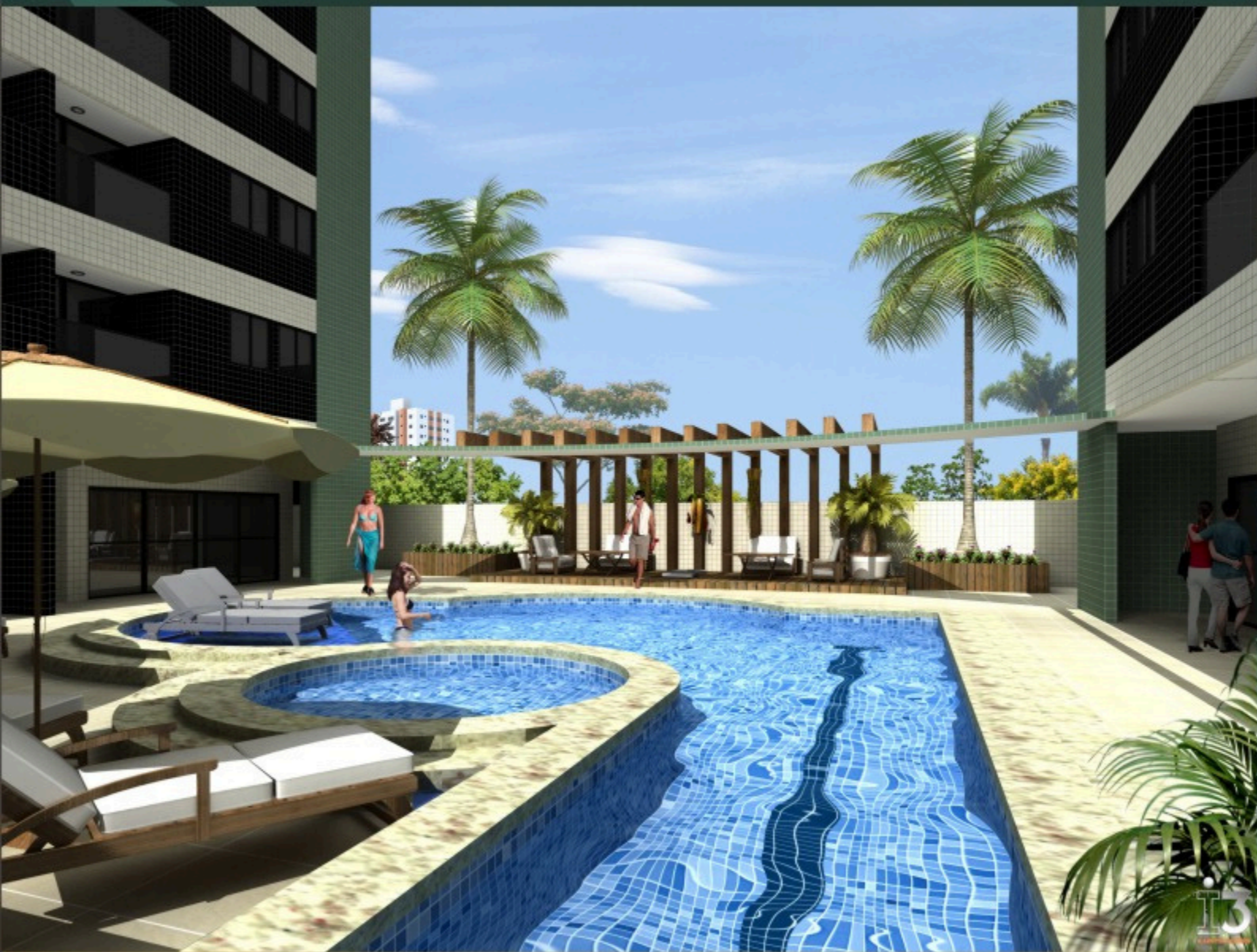
VISTA DA PISCINA E ESPAÇO ZEN