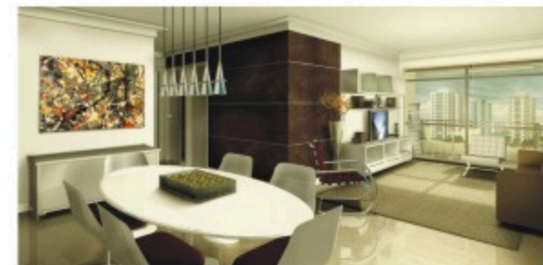
VISTA DA SALA DE ESTAR E JANTAR