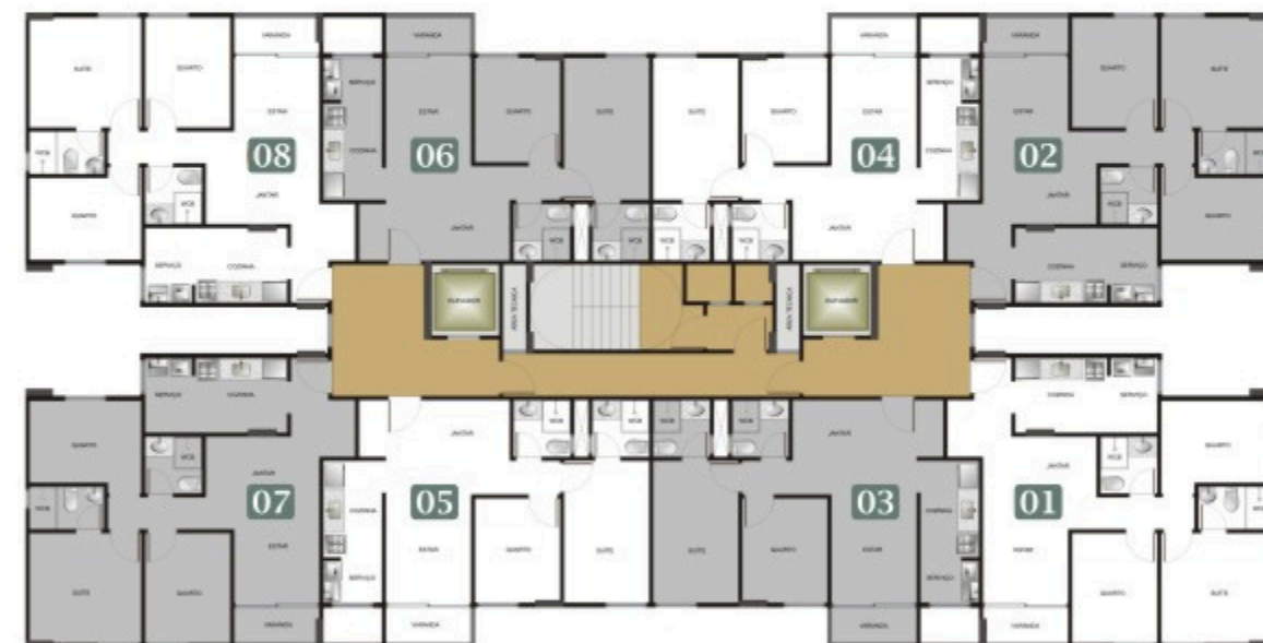
PLANTA BAIXA DO PAVIMENTO TIPO